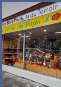
La Ferme du Pays d'Oc - Castelnaudary

Choisir une boutique Pays Cathare, qu'elle soit à dominante épicerie fine ou caviste, ou encore produits frais et primeur, c'est l'assurance d'y trouver une sélection de coups de cœur et de spécialités locales. Vous y trouverez également des informations sur les producteurs, des conseils de recettes, ou encore des dégustations.