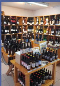
La Ferme du Pays d'Oc - Castelnaudary