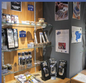
La Maison de la Truffe d'Occitanie - Villeneuve-Minervois