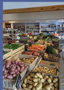
Les Jardins de Valsières - Vilasavary